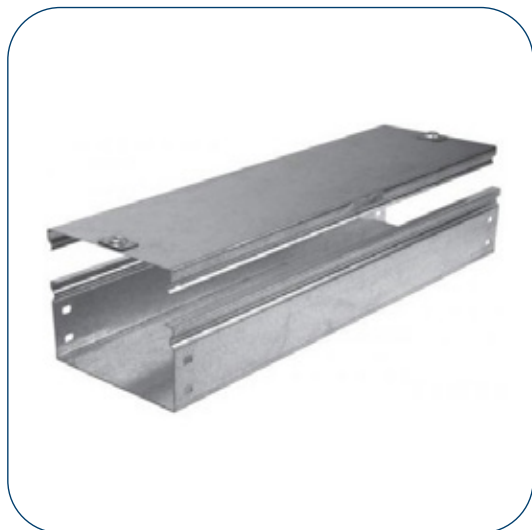
**Su función es principal es la conducción segura de los cableados eléctricos aéreos.

La bandeja portacable BANNEX se define como una estructura metálica, fabricado con plancha de acero al carbono recubierta con una capa de Zinc en ambas caras, mediante el proceso de inmersión en caliente, bajo la norma NEMA VE -1, las bandejas son fabricadas en un bastidor pre-fabricado, para que salgan de una sola medida y estructurada, sus laterales longitudinales tienen un tipo dobléz en "C", "V" y "Z" para que el montaje de las bandejas queden perfectamente encajadas y alineadas.